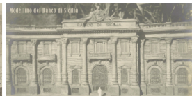
Modello del Banco di Sicilia