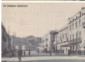
Via Tommaso Canalizzato